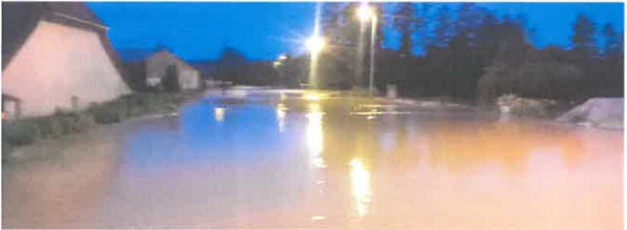
rue de Bréchaumont vers 3h du matin

Les photos sont impressionnantes : plusieurs orages ont déversé dans la nuit du 24 au 25 juin dernier des quantités de pluie inhabituelles sur notre village et fait débordé la rivière. Ce phénomène est intervenu dans un contexte de plusieurs semaines de pluies abondantes sur des sols saturés. La montée des eaux, extrêmement rapide, a inondé de nombreuses habitations, caves et garages... Très vite et partout, un élan de solidarité familiale, entre voisins ou amis, a permis de nettoyer, réparer et consoler... Les Sapeurs-Pompiers aussi, n'ont pas ménager leurs efforts et compter leurs heures pour se mettre au service de leurs concitoyens. Ils ont même assuré une entraide intercommunale car plusieurs villages voisins ont connu des dégâts semblables.