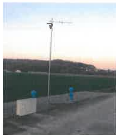
Antenne de télégestion du surpresseur à Traubach le Haut