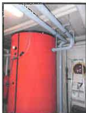
Travaux de chaufferie de la salle « la Traubachoise » : optimisation entre les 2 chaudières et le ballon permettant d'obtenir une température uniforme dans les 2 bâtiments. (Salle et groupe scolaire).