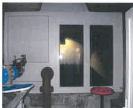
Réservoir de Traubach le Haut