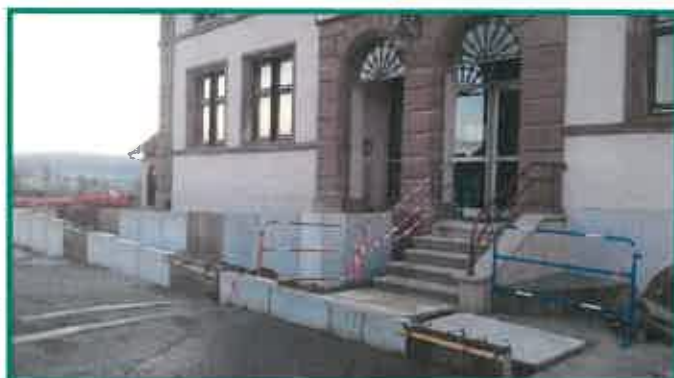
Travaux en cours: la rampe d'accès pour personnes à mobilité réduite à l'entrée de la mairie.